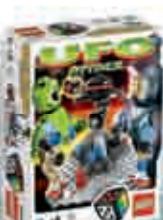
3846 UFO Attack 2-4 6+ 10-15