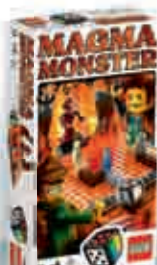
3847 Magma Monster 2-4 7+ 10-20