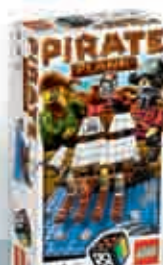
3848 Pirate Plank 2-4 7+ 10-20