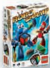
3835 Robo Champ 2-3 6+ 10-15