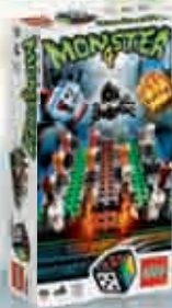
3837 Monster 4 2-4 7+ 15-20