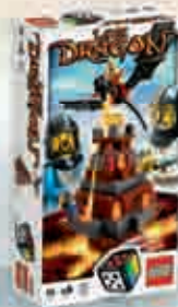
3838 Lava Dragon 2-4 7+ 15-25