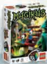
3836 Magikus 2-4 6+ 10-20