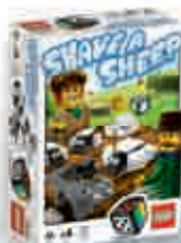
3845 Shave a sheep 2-4 5+ 10-15